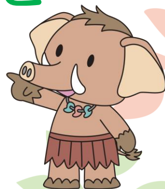
みどり市マスコットキャラクターみどモス