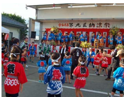
▲過去の納涼祭のようす

した。公民館は集団接種会場として使用され、多い日は、90人が接種を受けています。また、6月7日から、グンエイホールPAL(笠懸野文化ホール)でも集団接種が行われています。多くの市民へのワクチン接種が進み、以前のような公民館活動ができる日が早く訪れることを信じています。公民館の利用休止から約1ヶ月半が経過し、ようやく感染状況が落ち着き、客観的な数値も改善に向かい、県の警戒度が「3」に下がりました。公民館も6月22日(火)から部屋の貸し出しを再開しました。公民館事業も、新型コロナウイルスの影響で会議が開けず、停滞しています。部屋の利用再開後は、会議が開かれ議論も進むことでしょう。