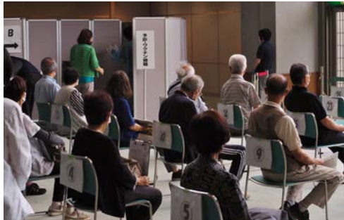
▲ワクチン接種会場として使用

県内の新型コロナウイルスの感染状況や病床の稼働率などの客観的な数値が悪化したことにより、群馬県は社会経済活動再開に向けたガイドラインの警戒度を5月4日(火)から「4」に引き上げました。それに伴い笠懸公民館は、5月7日(金)から部屋やロビーの利用を休止しました。施設の利用を休止していた期間には、みどり市でも高齢者を対象とした新型コロナウイルスワクチンの接種が始まりま