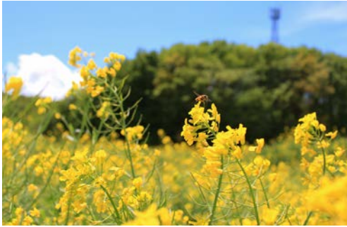
▲春は菜の花がきれいに咲く

岩宿博物館の東に琴平山(標高196m)があり、その先端の岩場が大間々扇状地展望台として地元の人とができます。