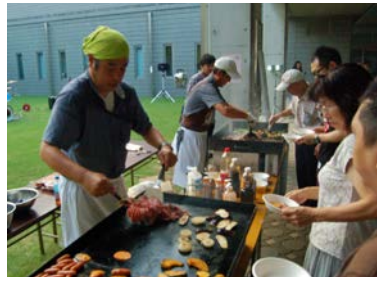
▲お肉を焼きながら交流

利用者の会は「誰もが使いやすい公民館」を目指しているいろいろな取り組みを行っています。そのためにも利用者同士の交流はとても大切だと思います。そんな中、公民館にBBQコンロがあるのを知った理事が利用者の会の理事会で利用者交流のためのBBQ大会を計画しました。