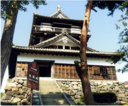
▲青空に映える天守

丸岡城は福井県坂井市にある日本100名城の一つ。城は柴田勝家の甥、勝豊が1576(天正四)年に築いたといえます。現存する天守(一二城)の中で最も古い建築様式です。 古図によれば丸岡城の内堀は五角形をなしており、急な階段を昇り天守の最上階から特徴的な五角形堀跡や市街が一望できます。 1948(昭和二三)年、