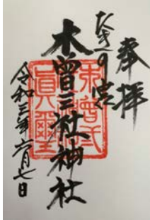
▲木曾三社神社の御朱印

笠懸市北橋町にある木曾三社神社に行ってみました。神社内は、自然に囲まれ水がとても豊富です。その水は、赤城山に降った雨が50年かけて浸透し湧き水として流れているそうです。県内で一番水が多いとのこと。週末には、水を汲みに来る人がたくさん訪れるそ