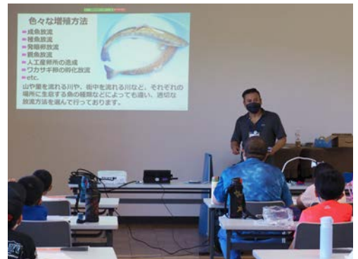
▲実践の前に魚を学ぶ

自然相手の釣りです。簡単には釣れないかなと思っ ていましたが、あちらこちらで釣り上げている様子が見られました。お昼の休憩時には、参加者全員にヤマメの塩焼きが配られ、大人も子どもも美味しそうにかぶりついていました。午後