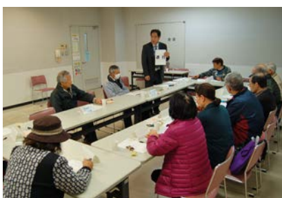
▲過去の懇談会の様子

利用者の会では、年中無休で理事さんの募集を行っています。志ある方は自由にご応募ください。もう手を挙げて歓迎します。