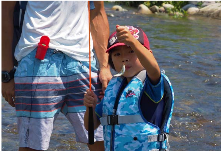
▲上手に釣れました♪

座学は2部屋を使って行われました。大部屋では講師がみんなの前で話し、小部屋ではZoomを使い、