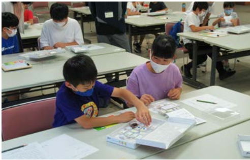
▲これを繋いでみようかな