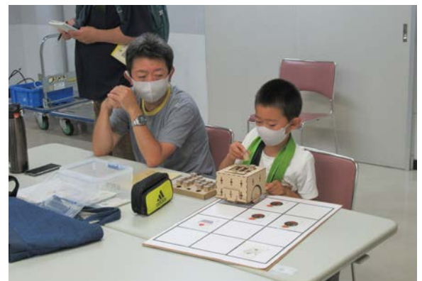
▲爆弾をよけて進めるように

続く午後の高学年向け教室にも18人の5、6年生が参加し、「P I E C E」（ピース）というプログラミング教材を使い、講師が出す問題を解決する機械を作りました。