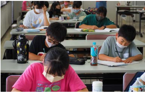
▲多くの子どもたちが参加

子どもたちは涼しい部屋で地域ボランティアの大人や学生が見守る中、もくもくと夏休みの宿題や自主学習をこなしていました。時折ボランティアの人が問題の解き方のアドバイスをしていました。