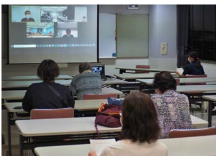
▲リモートで各部屋をつなぐ

で3部門同時開催の案が出されました。パルでの開催が可能であるか検討することで、閉会となりました。警戒度が上がらないことを願うばかりです。