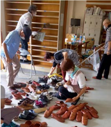
▲協力して隅々まできれいに

うに進みませんが、皆さんの使う公民館です。これからも、大切に使用していきたい」と皆さんのご苦勞をねぎらっていました。