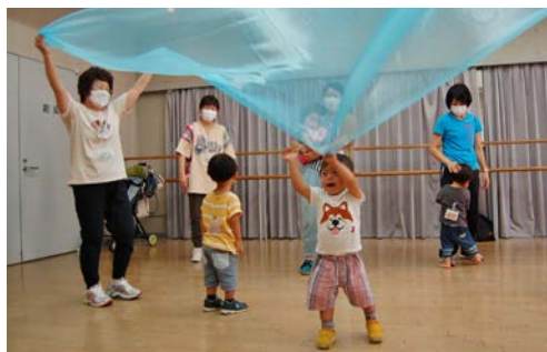
▲みんなの笑顔があふれる

アンパンマン体操から始まり、親子一緒になって、飛んだり跳ねたり、たくさん汗をかきました。我が子と共に手や足を伸ばし、体操するお母さんの額に光る汗が笑顔と共に輝いていました。子どもたちもすつかり打ち解けて部屋の中を走