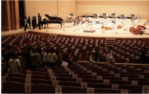
▲職員の誘導で避難

第5回避難訓練コンサートが11月23日(祝・火)笠懸野文化ホールで開催されました。今回はグンエイホール・笠懸公民館(株)グンエイの協力のもと、コンサートの中で震度5強の地震が発生し、その後給湯室から火災も発生するという想定