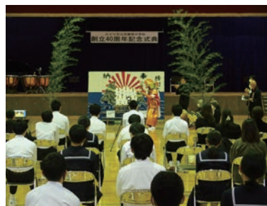
▲横町太々神楽保存会による奉納

最後は笠南合唱団がコロナ禍でなかなか人前で歌えなかった校歌をきれいなハーモニーで歌いイベントを盛り上げました。