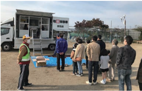
▲多くの参加者が地震を体験