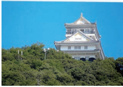
▲金華山山頂に建つ岐阜城

岐阜城は歴史の舞台で重要な役割を占めているように、度々、歴史の表舞台に登場していますね。文献に