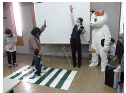
▲横断歩道は手を挙げて

その後、ぬいぐるみの「ねこ丸君」が登場。信号機の見方、横断歩道の渡り方などを説明、子どもたちも実践して学びました。ぬいぐるみのねこ丸君が珍しかったのか、帰る時は写真を撮ったり握手したり、なごり惜しんでいました。