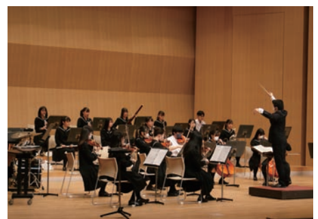
▲精一杯演奏する生徒たち

など今日を振り返ってもらうことで良い訓練になったと思う」との講評をいただき無事終了です。こういった訓練を実際に行っておくことは大切ですね。