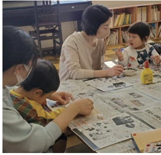
▲親子で一緒にスノードーム作り

8回目のお母さんと一緒教室は11月5日(金)に「スノードーム作り」をしました。5組の親子は子どものお部屋に元氣よく集まってきました。スノードームは透明な容器の中でちらちら雪が舞っているようなインテリアです。小さいペットボトルに、親子でビーズや細かく切ったミラーテープを入れて、洗濯のりと水を7対3の割合で注ぎました。キヤップを接着剤とテープでしっかりと止めて完成。思った以上に簡単で、あっという間にできあがりしました。子どもたちは上下に振り、