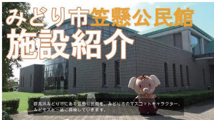
群馬県みどり市にある笠懸公民館を、みどり市のマスコットキャラクター、みどモスと一緒に探検していきます。

かさかけ公民館だより第170号でお知らせしていた情報発信事業の第一弾として、笠懸公民館施設紹介動画をいよいよYouTubeで配信を開始しました。