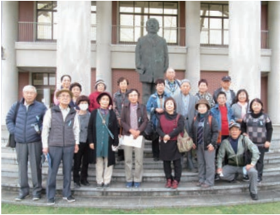
▲渋沢栄一銅像と記念撮影

参加者は、バス2台に分かれて、渋沢栄一記念館、旧渋沢邸「中の家」、尾高惇忠生家、誠之堂、清風亭を見学しました。第5講で渋沢栄一の偉業と人物像について学習したため、予習は十分です。それぞれの施