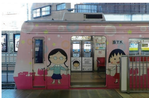
▲ちびまる子ちゃんラッピング車両

静岡県内を走る静岡鉄道 は新静岡駅と新清水駅の 11・0 kmを約21分で結んで います。全線複線で途中駅 は13駅あり、市内電車によ うです。以前は急行列車が 設定されていましたが、現 在は各駅停車のみとなって いました。