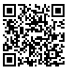
▲NO! 詐欺音頭 群馬県警察 HP

参加者の中には「コロナ禍での開催に敬意を表します」とアンケートの感想に書いてくれた方もいました。1年の締めくくりとして良い講座となりました。