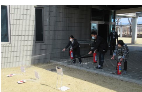
▲消火器の使い方を体験