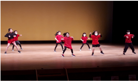
▲かっこよく踊っています

ダンスライブは、「文化祭が中止になり、子どもたちのために発表の場を作りたい」と有志から公民館に相談があり、実行委員会を組織し開催に向けて感染対