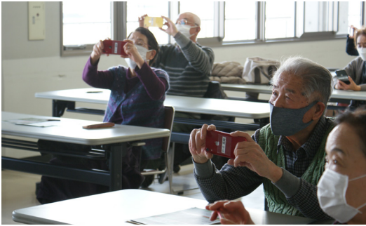
▲カメラ撮影を体験する参加者

笠懸公民館では65歳以上の市民を対象に「シニア向けかたんスマホ教室・入門編」を初開催しました。これは新型コロナウイルス感染症拡大の影響で開催できなかった講座で、感染防止対策を講じた上で、ようやく開催に至ったものです。同教室には14人が参加し、基本操作と無料通信アプリ「LINE(ライン)」の操作を2日間(1日2時間)に渡り学びました。講師・サポートを務めたのは