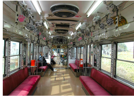
▲今年の干支が飾られている車内

このほど、群馬県と沿線3市(前橋市・桐生市・みどり市)で構成する「上電沿線市連絡協議会」が沿線各地を利用者に足を運んでもらおうと、車両のペーパークラフトを作成しました。全8種のペーパークラフ