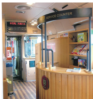
▲まごころ列車の車内