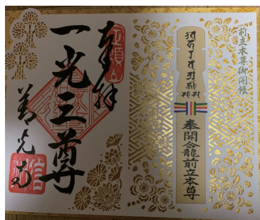
▲善光寺御開帳御朱印

開帳をしていて秘仏を拝観できません。上田市と千曲市が新たに日本遺産に認定され、長野県の日本遺産は4件になりました。それに伴って認定されたお寺と神社に「日本遺産」ののぼり旗が立って、御朱印も日本遺産のマークが入っている特別なものが頂けます。