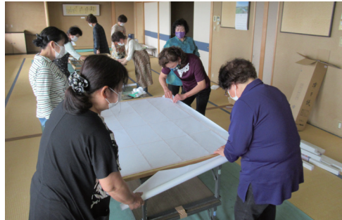
▲協力して作業を行いました

翌週の6月12日(日)には障子の張り替えを行いました。笠懸町婦人会と利用者の会の理事の皆さんの協力により、真新しいきれいな障子になりました。