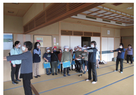
▲体操のサークルを見学