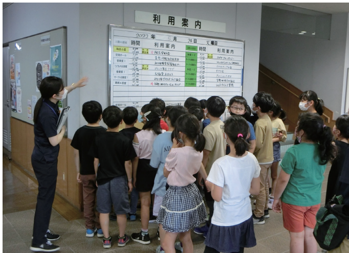
▲利用案内板の説明

6月8日(水)に笠西小の順で、どの学校の児童たちも物めずらしそうに施設内を見て回り、公民館職員の一部屋の紹介や利用しているサー