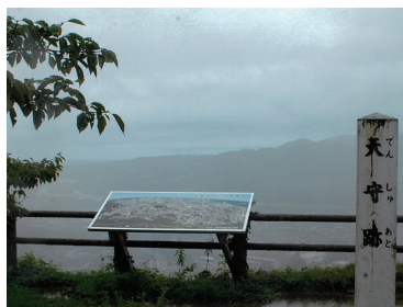
▲天守跡から日本海を望む

山麓部に御殿と政庁機能が置かれたとあります。北日本には珍しい総石垣づくりで、標高135mの臥牛山山頂に築かれています。石垣のみが残りますが、私の足で天守跡まで四ツ御門跡(十字路となっている)の石垣を見て約20分の道のり。山頂の天守跡から日本海が望めます。