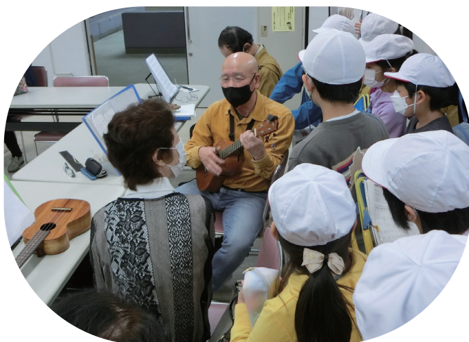
▲ウクレレサークルが1曲演奏披露

クルについての説明を一生懸命聞き取っていました。公民館施設の説明もサークルの皆さんの活動も児童たちにとってはとても新鮮に映ったようです。 見学中は、活動中のサークルの人たちにも質問し、活動内容について教えてもらっていました。 見学終了後、児童たちが