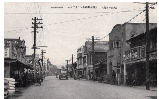
▲なつかしい街なみ

年配の方にとっては子供 の頃を思い出させる懐か しい風景もあったようで 「私もあの沼で魚釣りをし た!」と声を上げる参加者 もいました。 何気なく撮った風景写真