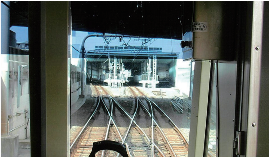
▲浦和美園駅を発車

お得な一日フリーキップ 土、日、祝、11/14(埼玉県民の日)、12/30、1/3 限定 580円