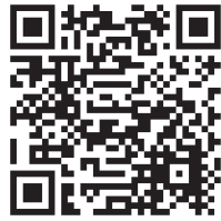
▲みどり市HP かさかけ公民館だより カラーで見られますよ！

メイン企画についてはいくつか案が出され、今後さらに詳しく調べながら検討し、決定して行く方向になります。