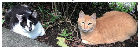
▲ご支援をお待ちしています

っていると思う人もいますので、まずは地域猫活動がある事を多くの人に知ってもらい、それぞれが理解したうえで活動への協力、いら