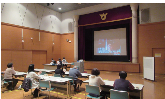
▲ストップ！高齢者虐待

高齢者への虐待は、養護者や施設従事者などさまざまです。早期発見・通報が大切で、通報するにあたり虐待の判断は不要です。間違ってもいいからまずは通報してほしいそうでも、また通報者の保護も大切であることを述べていました。その他、高齢者虐待を