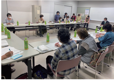
▲定期総会お疲れさまでした!!

笠懸町婦人会の定期総会が5月12日(金)笠懸公民館で開催されました。今年度は新型コロナウイルス感染症の分類が第5類に移行したことに伴い、3年ぶりの開催です。