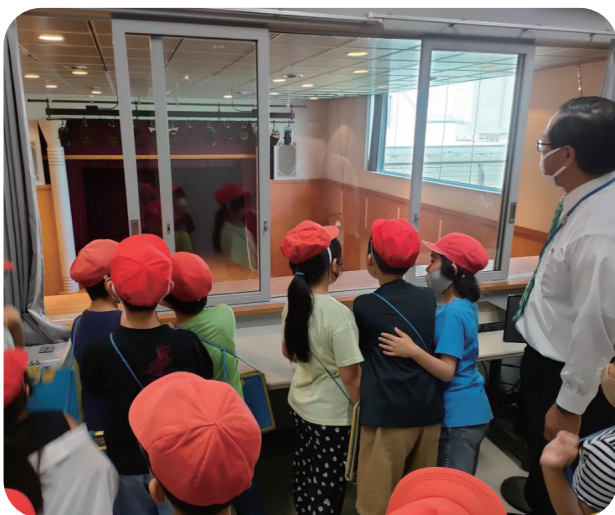
▲調整室から交流ホールをのぞき見