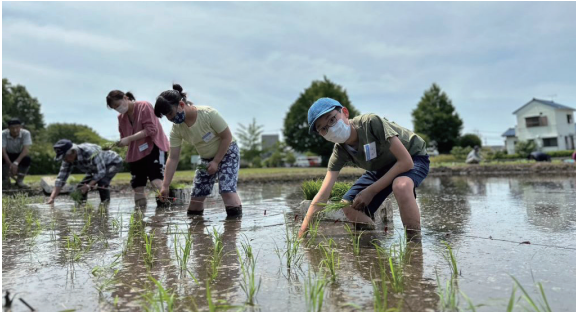
▲たくさん実ってね!!