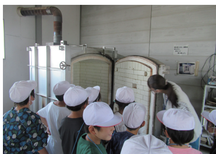
▲大きな陶芸窯にびっくり!?