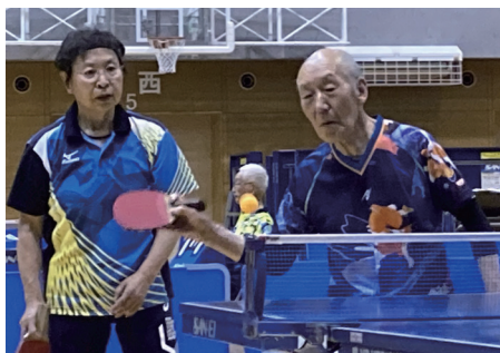
▲絶妙なチームワーク

前半は男女それぞれ年齢別シングルスでブロックごとに熱き戦いを繰り広げました。後半は抽選による組み合わせで親善ダブルスを行いました。初めて組んだとは思えないチームワークの良さに驚きです。館内には激励と歓声が響いていま