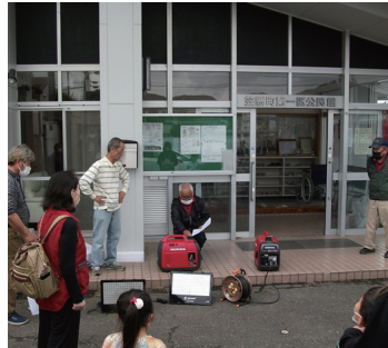
▲使い方を覚えよう

その他に、今年は約4年ぶりとなる納涼祭を8月に予定しています。子供から大人まで楽しみにしている1区公民館最大のイベントです。納涼祭実行委員をはじめ、協力してくださる関係者の方々と力を合わせて盛り上げていきたいと思っております。