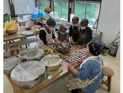
▲お昼ご飯の準備中

会の人たちの作った古代米の赤飯や天ぷらうどん、昔ながらの煮魚、煮豆、おから、タケノコなどのボ