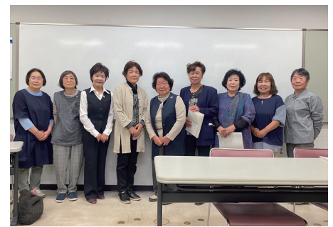
▲新役員のみなさん

5月26日(金)には、公民館で新役員の顔合わせがあり、今年度の事業に向けて話し合いが行われました。ポランテアなどで忙しい婦