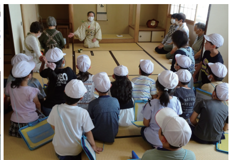
▲活動中におじゃましまーす!! (左から絵画サークル、書道サークル、茶道サークル)