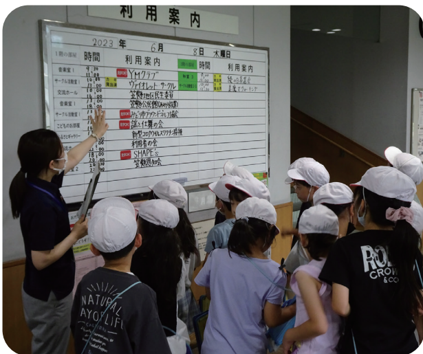
▲利用案内板に興味津々!!

に子どもたちを対象にしたイベントを企画しています。ぜひまた子どもたちに足を運んでもらい、地元の施設を交流や学習の場として有効活用してほしいですね。