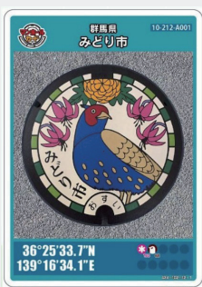
▲みどり市のカード