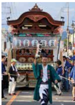
「山車巡行」 桐生市