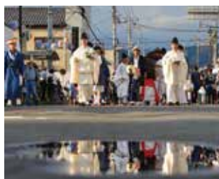
「打ち水を鏡に」 高崎市 / 染谷 巖