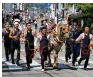
「疾走 神を乗せて」 伊勢崎市 / 黒澤 潔