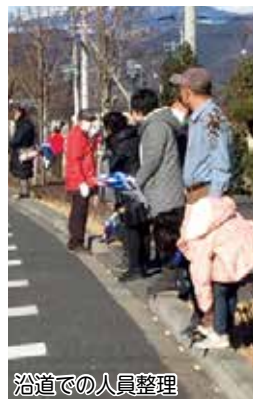
沿道での人員整理

申込・問い合わせ先 スポーツ振興課 ☎376-0192 みどり市大間々町大間々1511 ☎(46)9068、電子メール sports@city.midori-gunma.jp