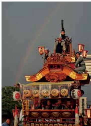
「虹と共演」 桐生市 / 田沼 慎一郎