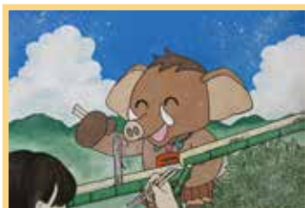
「流しそうめんを楽しむみどモスと私たち」 藤生 夏喜 (笠懸南中2年)