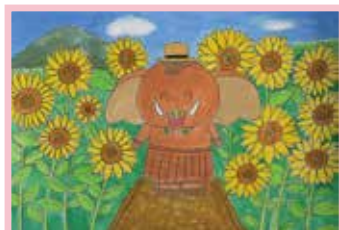
「みどモスとひまわりばたけ」 新井 ましろ (大間々北小2年)