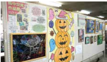
プレ作品展の様子 (笠懸庁舎)