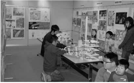
▲ 1階ロビーの図工美術作品展示