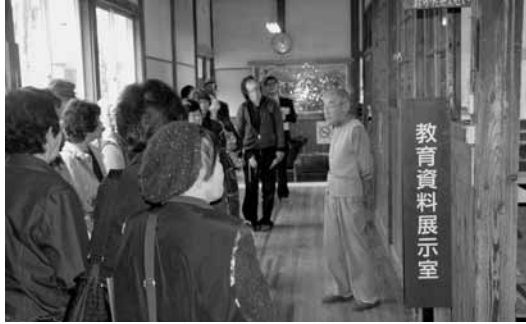
▲旧花輪小学校記念館で説明を聴く参加者

午前9時に市のバスでみどり市役所大間々庁舎北側駐車場を出発し、渡良瀬溪谷の紅葉を楽しみながら東町へ向かいました。