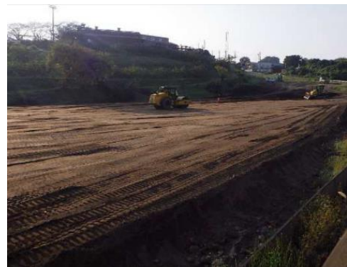
南側の盛土工事の様子

みどり市ホームページでも公園づくり通信を配信しています。 右のQRコードを読み取ってご覧ください。