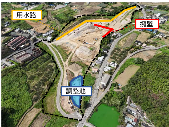
西鹿田グリーンパーク予定地