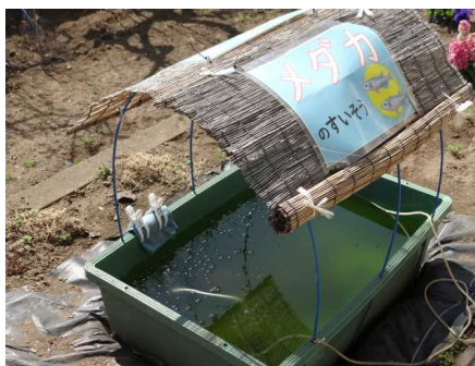
本館南の水槽で泳ぐメダカ