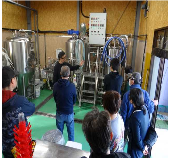
ビール醸造所を訪問した受講生