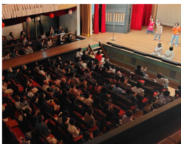
来場者150人の手拍子で会場は盛り上がりました

ジカル「夢をかなえる魔法の時間」に移りました。 ながめ余興場へ迷い込んで来た主人公が出会った一冊の本。開いた人が「見たい世界」を映し出す魔法のストーリーブックを鍵として展開していきます。 本を開くたびに現れる、夢を抱くプリンセス、立ち上がる悪者たち。そして、迷いながらも一歩を踏み出していく、願いごとは強く願うことで必ず叶うのだと、主人公は