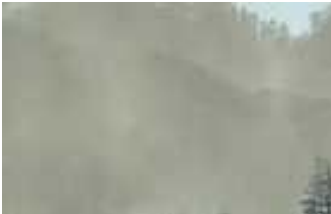
霧や雲ではなく花粉です