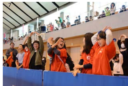
1 / 記録を達成し公式認定証を受理した瞬間、2 / 中心となって作業を行った小学5年生、3 / すき間ができないように慎重に並べる様子