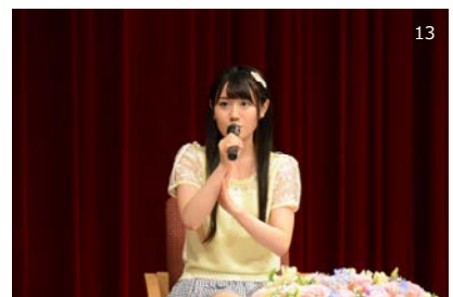
1 / イベントPRバナー、2・4・5 / ながめ公園の様子(メイン会場)、3 / テープカットの様子(オープニングセレモニー)、6 / くまどり花壇、7 / 花さかじいさん春の菊人形 8 / 岩宿の里(サテライト会場)に登場したぐんまちゃんのふわふわドーム、9 / 原人大花壇、10 / 鹿田山菜の花畑(ふれあい苑)、11 / 富弘美術館(サテライト会場)のメルヘン花壇 12 / ひな牡丹園(ふれあい苑)、13 / 超満員となったみどり市出身の声優・小倉唯さんのトークショー