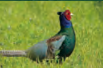
市の鳥 ■ キジ