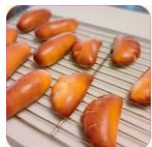
もものはベーカリー パン・ドーナツ