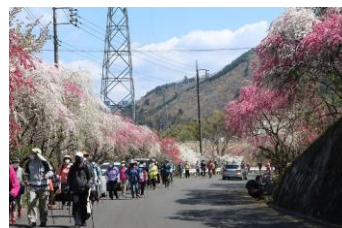
↑ 昨年のイベントの様子

東町内の花桃を楽しみながら健康増進できる「ノルディック・ウォーク」イベントを開催します。ポールを持って楽しく歩いてみませんか？