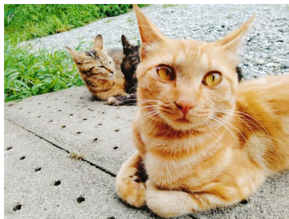
パン屋の看板ねこさんたち