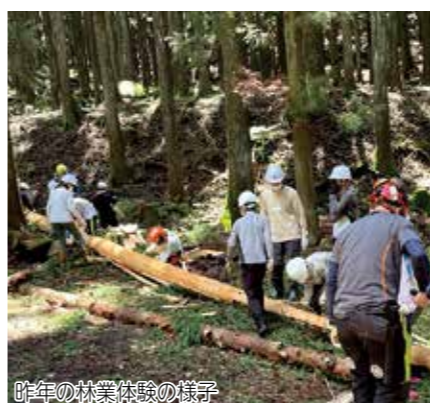
昨年の林業体験の様子