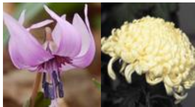
市の花 カタクリとキク