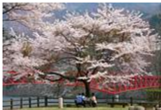
市の木 サクラ（ソメイヨシノ）