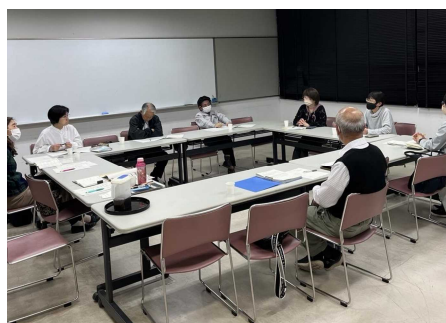
↑ 会議の様子。月1回程度夜間に開催され、講座内容等を話し合います。

↓ 令和7年度市民講座第2講 「防災対策と簡単に作れる便利グッズを学ぼう！」の様子。