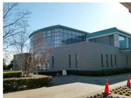
↑ 会場の笠懸公民館