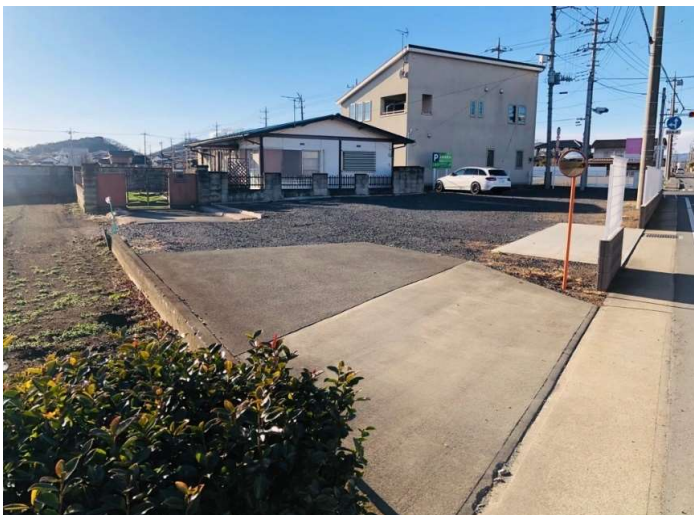
付帯物件(公衆用道路)部分