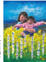
「やっぱり想い(ハート)」 TONPi Magic 一般奨励賞