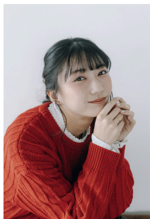
大川 楓佳 (おおかわ ふるか) (俳優/モデル/ラジオパーソナリティー)