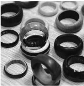
木材を使って製作した指輪

将来の夢は、自分の工房を持つことです。一から自分で建ててみたいですね。喫茶店も併設して、地元の人などでにぎわい、長く愛される場所になったらいいと思います。