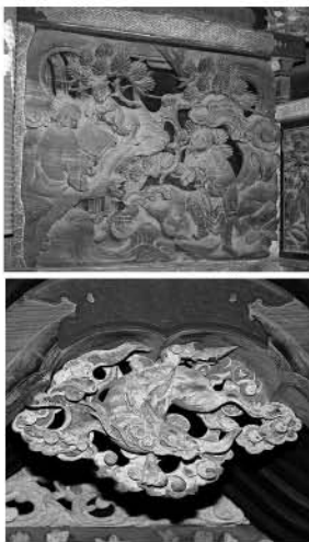
上：3枚胴羽目のうちの1枚 下：龍の彫刻

江戸から明治期において、花輪の彫刻師たちは 関東各地に素晴らしい彫刻を残しています。県内 では、雷電神社や榛名神社などが有名です。 今回紹介する、小夜戸稲荷神社も花輪の彫刻師 たちの手によるもので、1791年に建立されま した。市内にある、菅原神社・木の宮神社は、こ の小夜戸稲荷神社の影響を大きく受けています。 小夜戸稲荷は「地紋彫り」と呼ばれる装飾彫刻 が柱などに彫られています。これ自体は珍しいも のではありません。驚くべきはその種類で、柱は 面ごとに彫る紋様が異なります。 また、本殿階段部分は1本の丸太から「彫り出 された」もので、非常に手間がかかっています。 しかしながら、彫刻の内容は、不可思議です。 「仙人になる前を描いた3枚の胴羽目」「鳳凰で はなく鸞を描いた水引虹梁」「滝を登らない鯉」 「龍でなく応龍」。これらが指し示している言葉 があるとすれば「未熟」ということ。 この謎を解くのは、正面毛通しに描かれている 「麒麟」かもしれません。麒麟は仁政の世に現れ、 麒麟児は「才能が豊かで、将来が期待される子ど