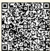
かぶらき 鍋木 このみ 9カ月

3歳未満(受付時点)のお子さんの写真を募集しています。お子さんの笑顔を広報紙面に掲載してみませんか。お子さんの氏名(ふりがな)、年齢(○歳○カ月)、住所、電話番号、保護者氏名、コメント(40字以内)を明記し、お子さんの写真を添えて秘書課広報広聴係(笠懸庁舎)へ。