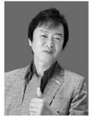
川野夏美さん 新沼謙治さん