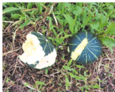
ニホンザルにかじられたカボチャ

丹精込めて育てた作物が、たった一晩で荒らされてしまう野生鳥獣による被害は、農家などにとって生活の糧を失う大きな問題です。