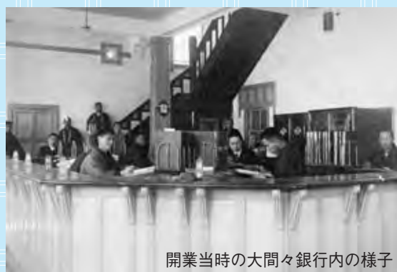
開業当時の大間々銀行内の様子