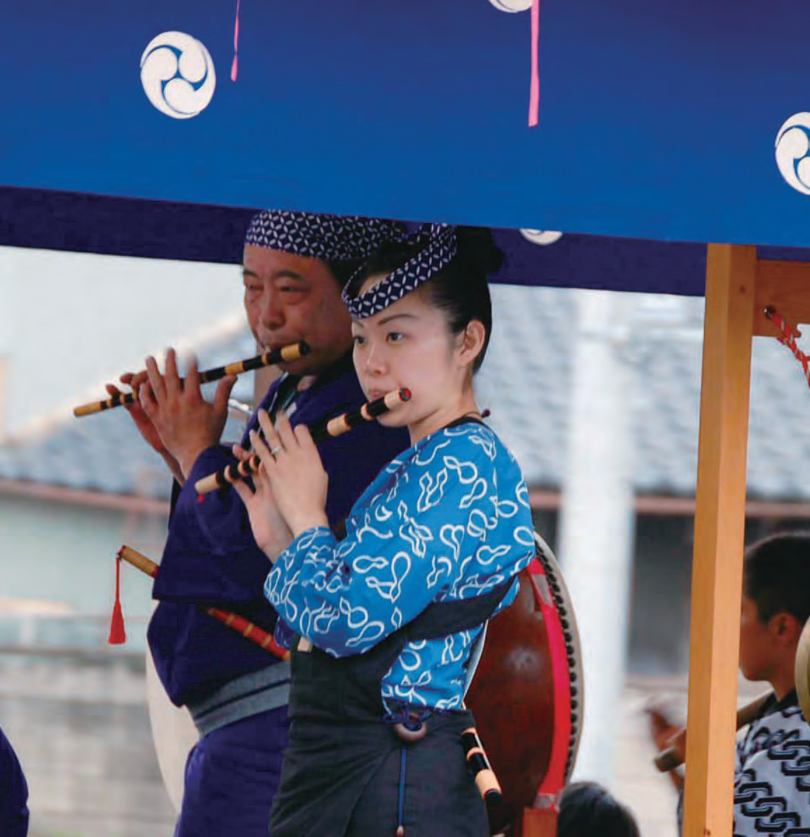
涼やかな笛の音とともに行き交う山車（8月2日、大間々祇園まつり）