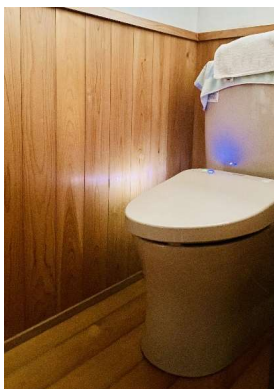
リフォーム済みトイレ