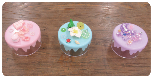
▲自分らしさが詰まった宝物

運営には7人の中学生がボランティアとして協力。開始1時間半前から熱心に手順を学んだ中学生たちは、緊張しながらも受付や補助で頼もしく活躍しました。 制作では、講師の丁寧な指導や、ボランティアのアドバイスを参考に、子どもたちが色とりどりのパーツを組み合わせて自分だけの作品を完成させました。 参加者からは「自分らしくデコレーションできてうれしい」と笑顔が弾け、ボランティアからも「子どもとの交流が良い経験になりました」との声が寄せられました。