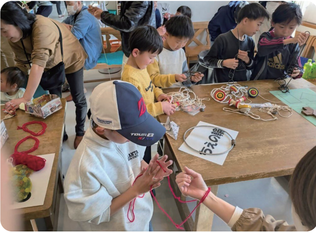
▲『昔の遊び』って新鮮

館内では輪ゴム射的やビンゴボードゲーム、健康麻雀などが人気を集め、「むかしの遊び」コーナーでは