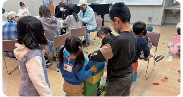
▲お友達と一緒に元気いっぱい

保護者は配られた写真で1年の思い出を振り返りながら、写真を丁寧に取り貼りして、思い出いっぱいの1ページを作りました。