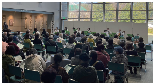
▲この活気！ロビーは超満員！！

軽やかなマンドリンの音色が響き、まるで一足早く春が訪れたかのような、温かなひとときでした。