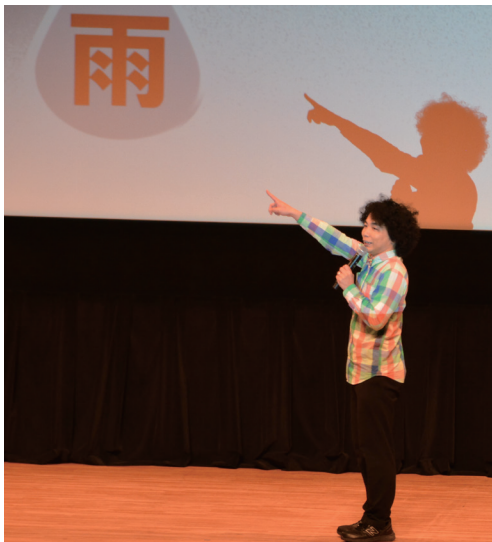
▲クイズを交え楽しく解説

出題するなど、大人から子どもまで楽しめました。参加者は身近な気象現象や防災の知識に驚きの声を上げ、熱心にメモを取る姿も見られました。最後は「詳細な防災情報は、気象庁のホームページを積極的に活用