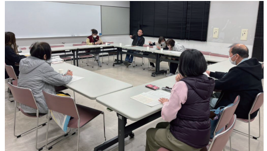
▲真剣な議論が続きます