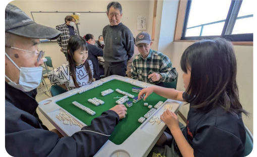
▲多世代で楽しむ健康麻雀!!

大人たちが子どもにベーマヤメンコのコツを教える微笑ましい光景も。屋外グラウンドでは「モルック」に歓声が上がリ、