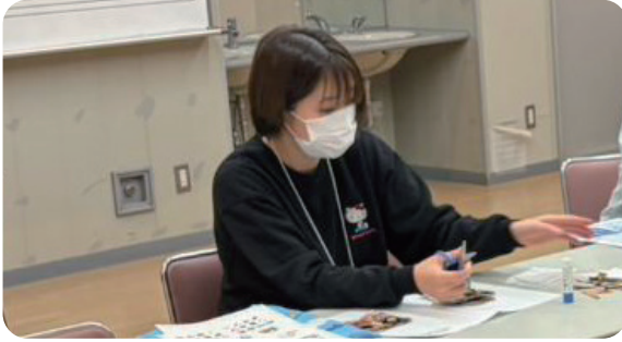
▲思い出を振り返りながら