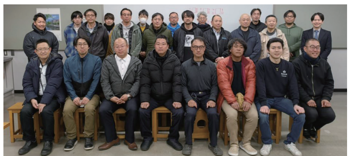
▲1年間、地域を支えた館長・主事の皆さん

本協議会として参加した笠懸地域文化祭では、恒例となった模擬店を出店。初日はあいにくの雨模様でしたが、2日間にわたり地区を越えた協力体制で運営し、多くの来場者に喜ばれていました。悪条件下でも一致