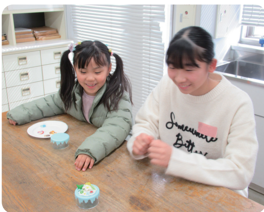
▲お姉さんと一緒に「できた！」

年代や学校の垣根を越えて触れ合ったこの日は、年度末を締めくくるかけがえのない思い出となったようです。