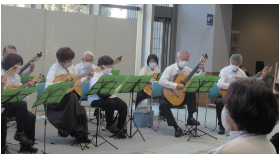
▲息ぴったりな演奏にうっとり

「ボニータ」はスペイン語で「美しい」「可愛い」という意味で、その名のとおり、やわらかく美しい音色で観客を魅了しました。演奏では、美空ひばりの「津軽のふるさと」、イル