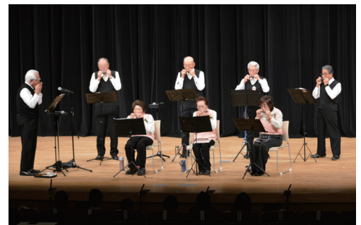
▲ホールに響くハーモニカの音色

場。「長崎の鐘」など馴染み深い4曲を披露しました。ホールに響き渡る繊細で温かい音色に、会場からは惜しめない拍手が送られました。