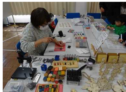
ワークショップコレクション 昨年の様子