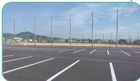
駐車場をアスファルト舗装