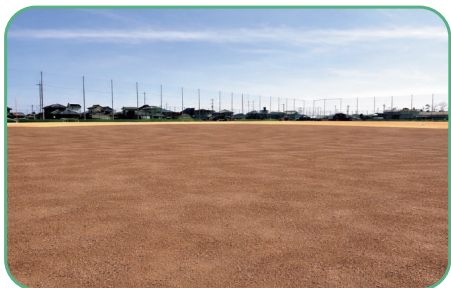
内野の土を入れ替え