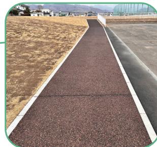
ウォーキングコースを新設