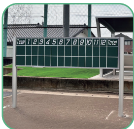
スコアボードを改修