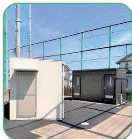
管理棟とトイレを改修