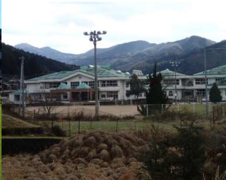
養父市立建屋小(兵庫県)