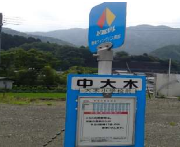
泉佐野市立大木小 (南海バス犬鳴線)