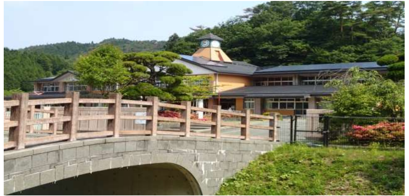
三田市立母子(もうし)小(兵庫県) (その8-②)