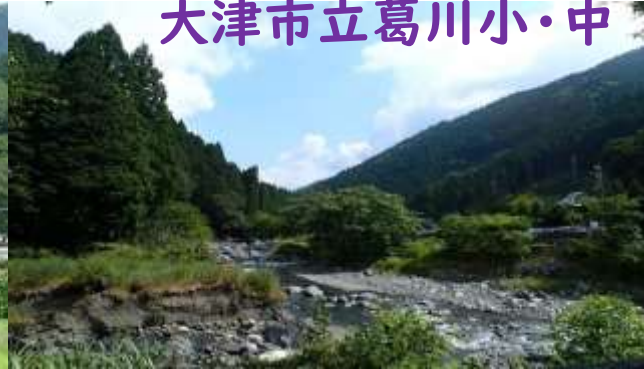
大津市立葛川小・中