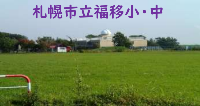
札幌市立福移小・中