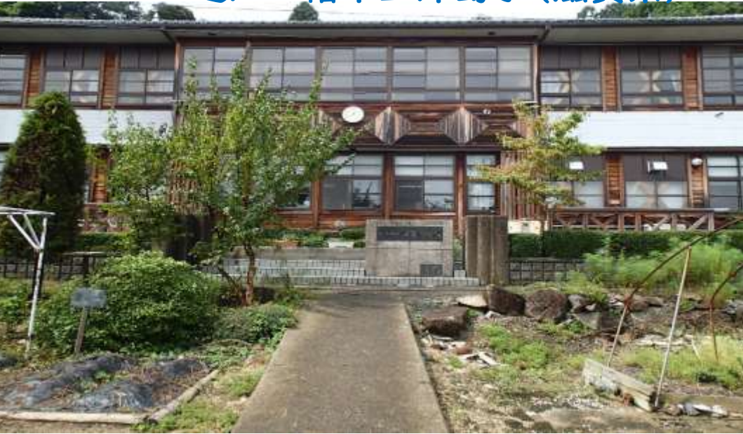
近江八幡市立沖島小(滋賀県)