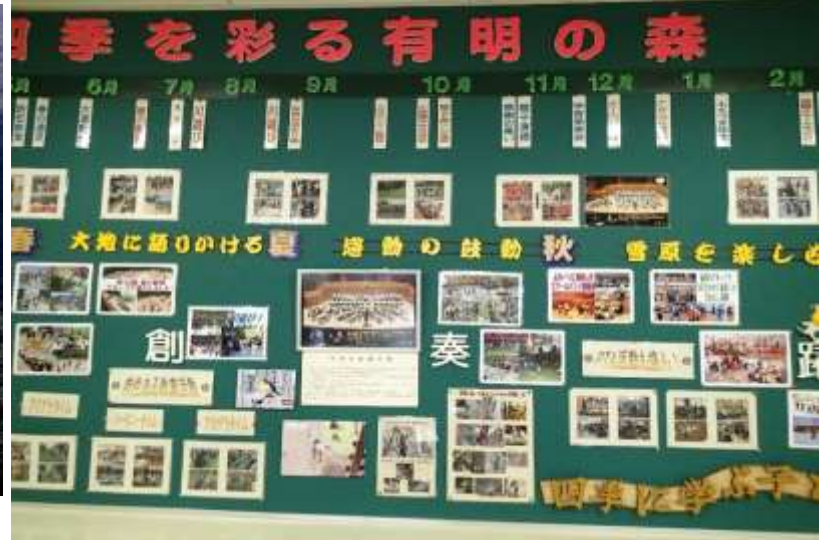
札幌市立福移小・中