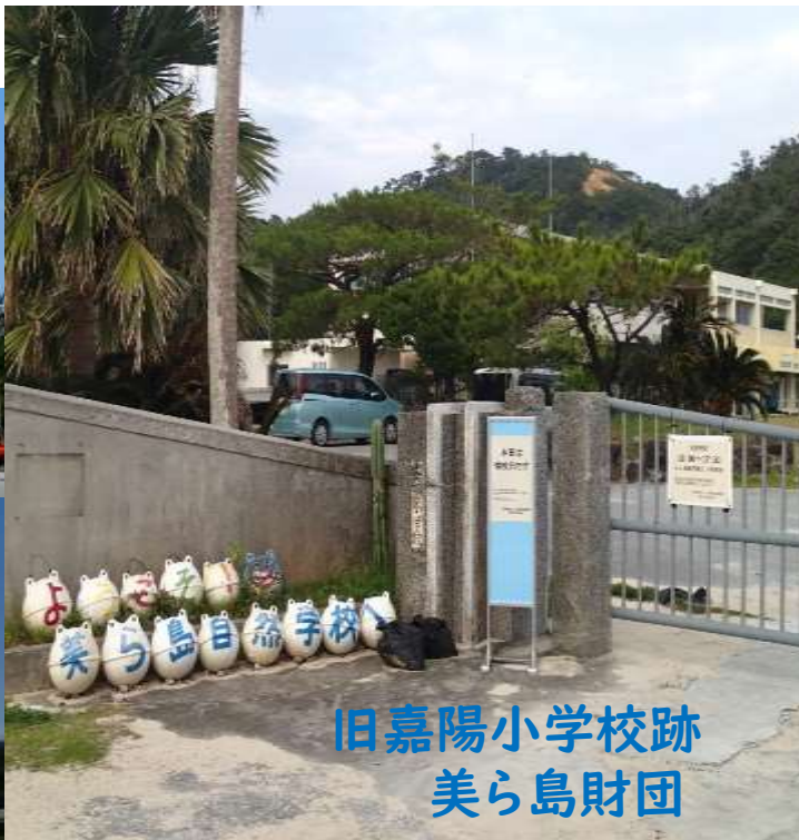
旧嘉陽小学校跡 美ら島財団