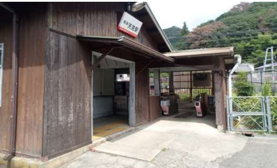
河内長野市立天見小 (南海電鉄高野線天見駅)