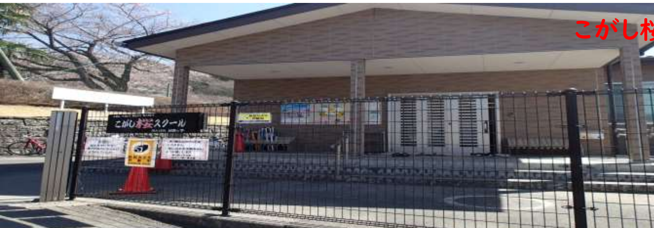
こがし桜スクール