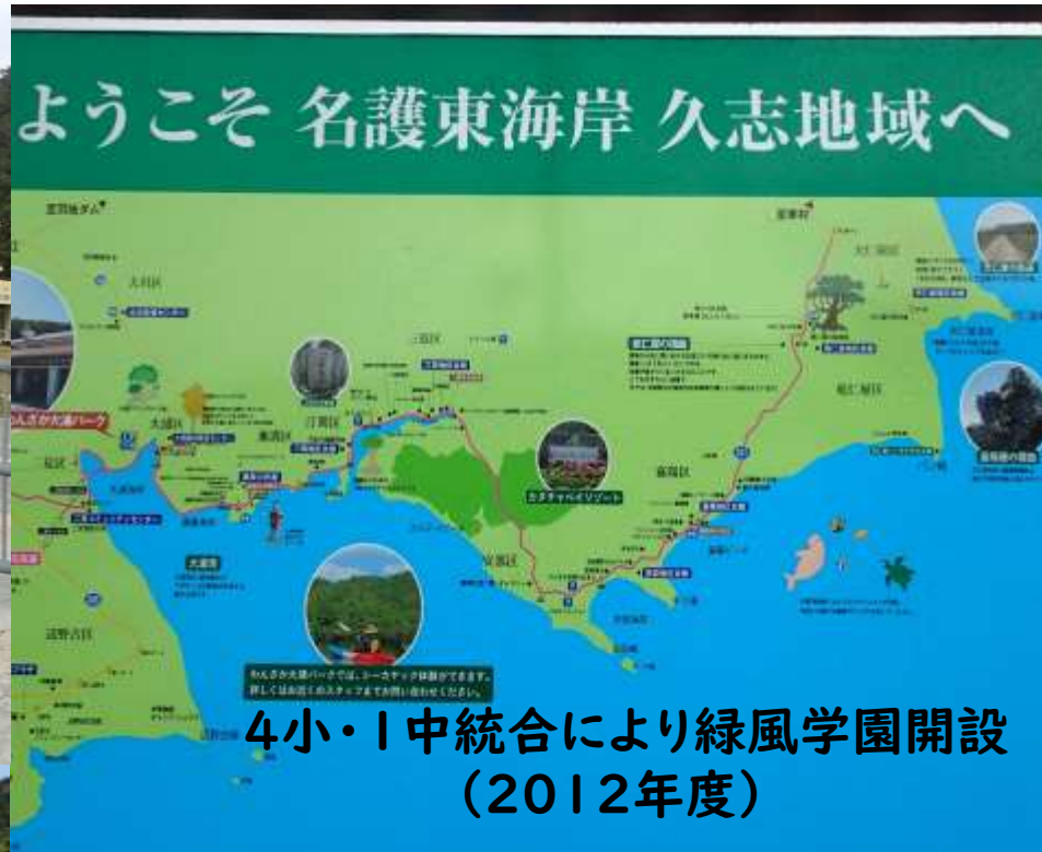
4小・1中統合により緑風学園開設 (2012年度)