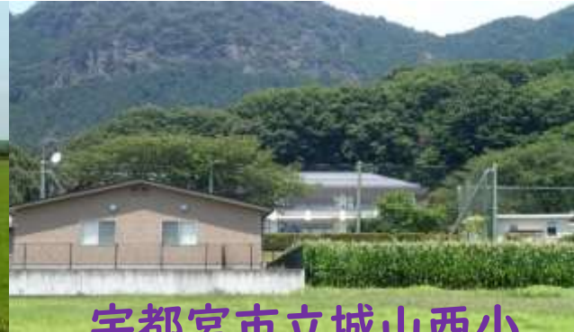
宇都宮市立城山西小