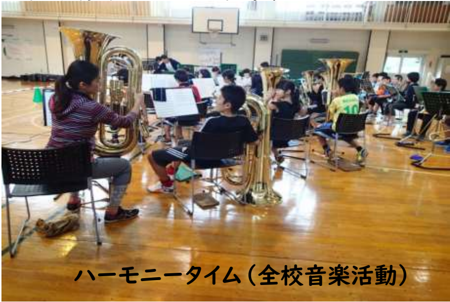
ハーモニータイム(全校音楽活動)