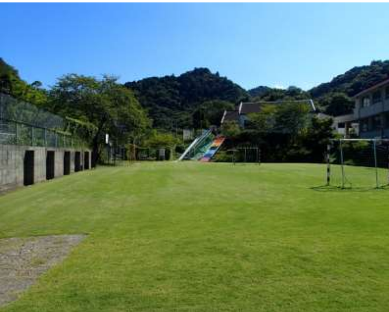
泉南市立東小(大阪府)