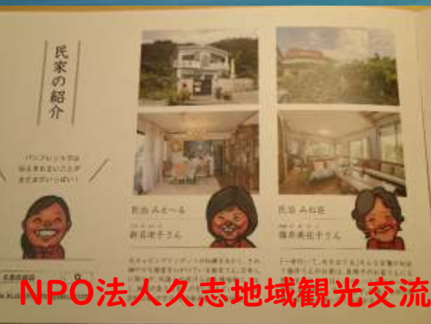
NPO法人久志地域観光交流協会