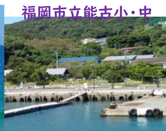
福岡市立能古小・中