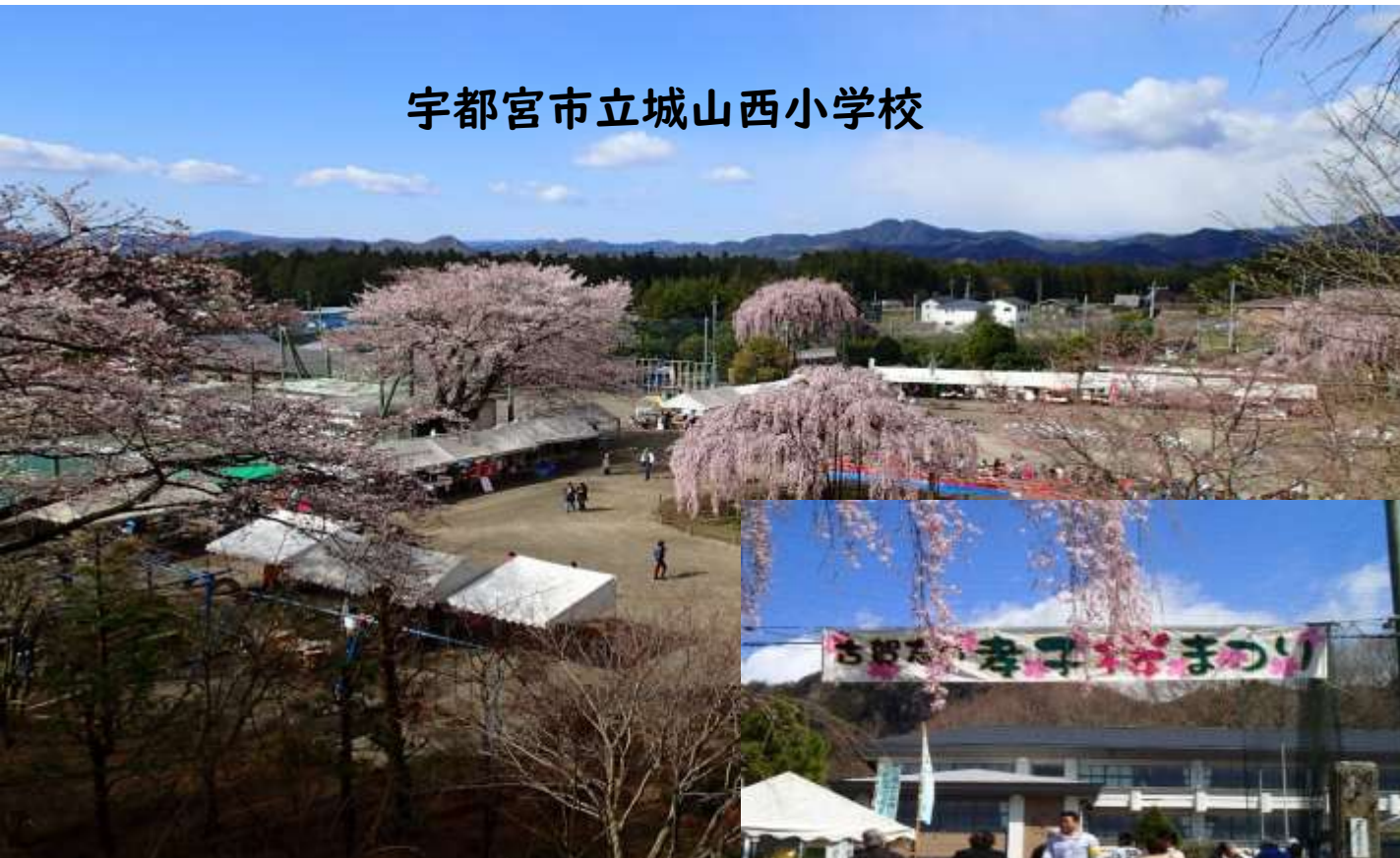
宇都宮市立城山西小学校