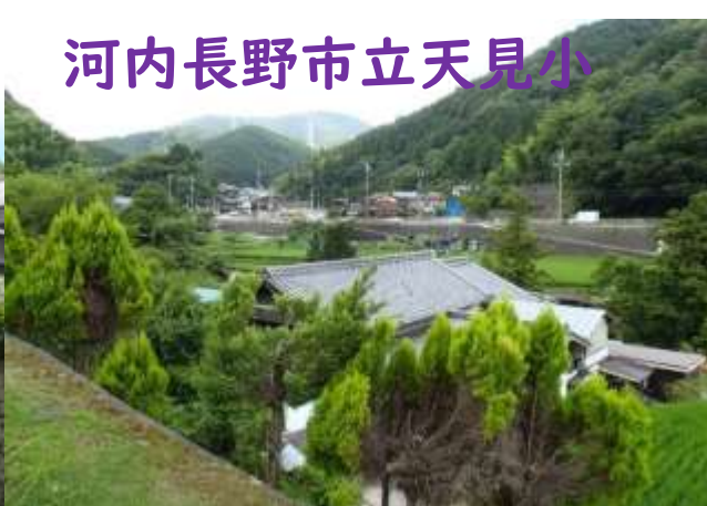
河内長野市立天見小