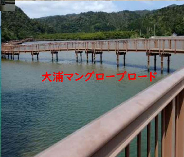
大浦マングローブロード