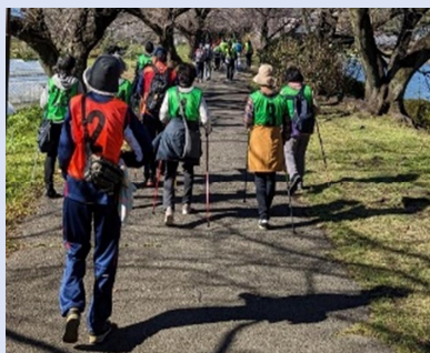
ポールウォーキング教室