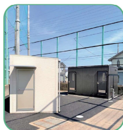
管理棟とトイレを改修