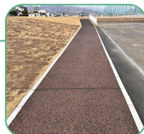
ウォーキングコースを新設