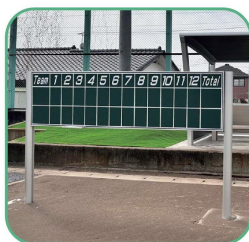
スコアボードを改修