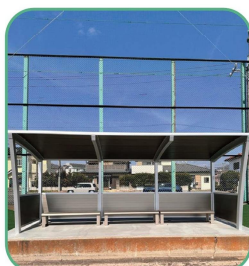
観客用ベンチを新設