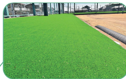
観客スタンドに人工芝を敷設