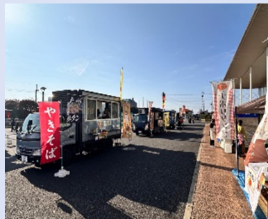
キッチンカーの出店