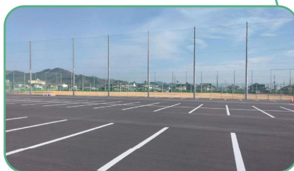
防球ネットを新設 駐車場をアスファルト舗装