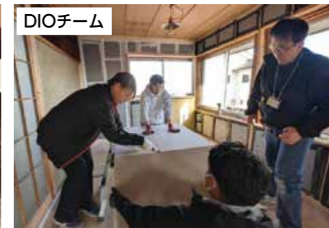
DIO (仲間を集い取り組む) を体験しリノベーション手法を学ぶ