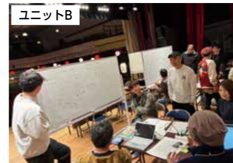
元惣菜店を復活させ「おふくろの味」を提供するプロジェクト

今ある資源を活かして、地域の課題解決やエリア価値の向上を目指し、民間と行政が一体となって取り組んでいるリノベーションまちづくり。2回目となるリノベーションシヨンスクールを開催しました。