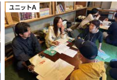
空き店舗を活用したカフェと地場野菜やお米を活かしたプロジェクト