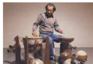
陶製の創作楽器「水留音」