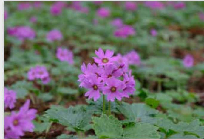
世界にここだけの花 小平の“カッコソウ”