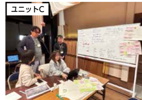
空き家を活用し地域の人に朝ごはんなどを提供するカフェプロジェクト