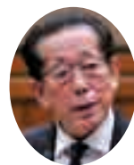
松井 篤 議員