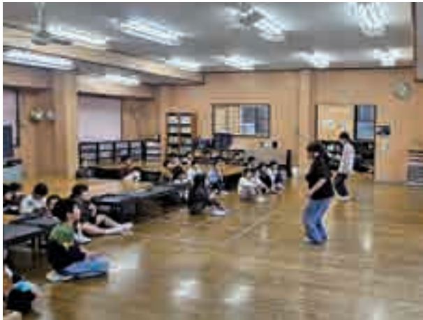
第1笠懸東学童クラブ