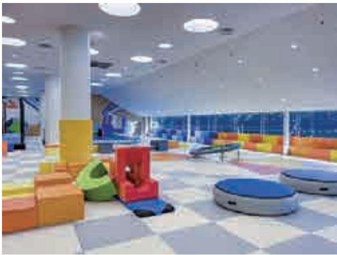
屋内遊び場の先進地（唐津市）