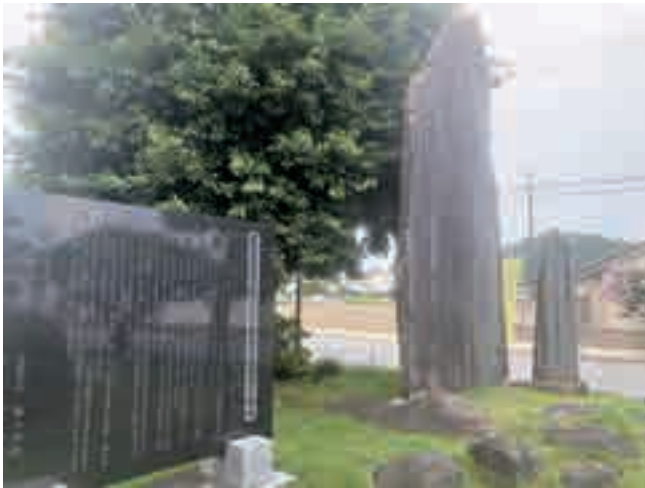
笠懸庁舎正面入口の石碑群