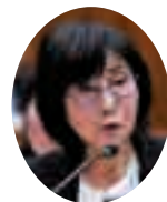
須藤 日米代 議員