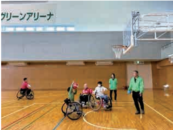
令和11年に国スポ・全スポが開催される *桐生大学グリーンアリーナ