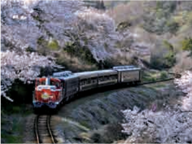
みどり市内の撮影スポット