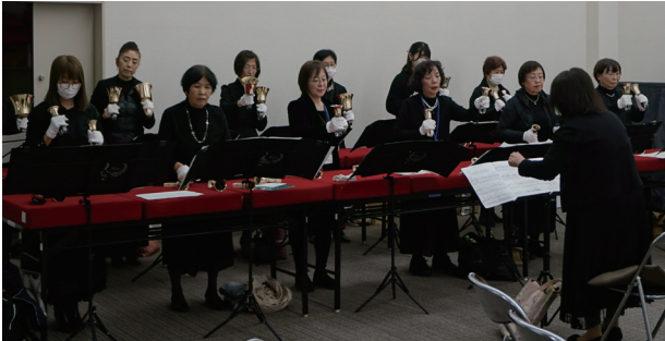
▲息の合ったハンドベル演奏

前半は、東地区を中心に活動する3団体の取り組み発表がありました。まず「ハンドベル演奏で