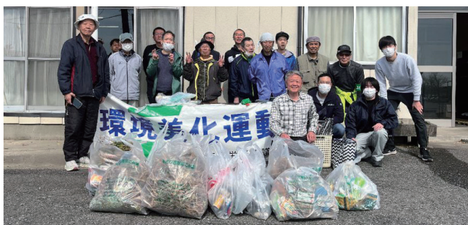
▲清掃完了! 集めたゴミと一緒にパシャリ📷