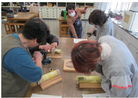
▲ドリル作業に没頭中!