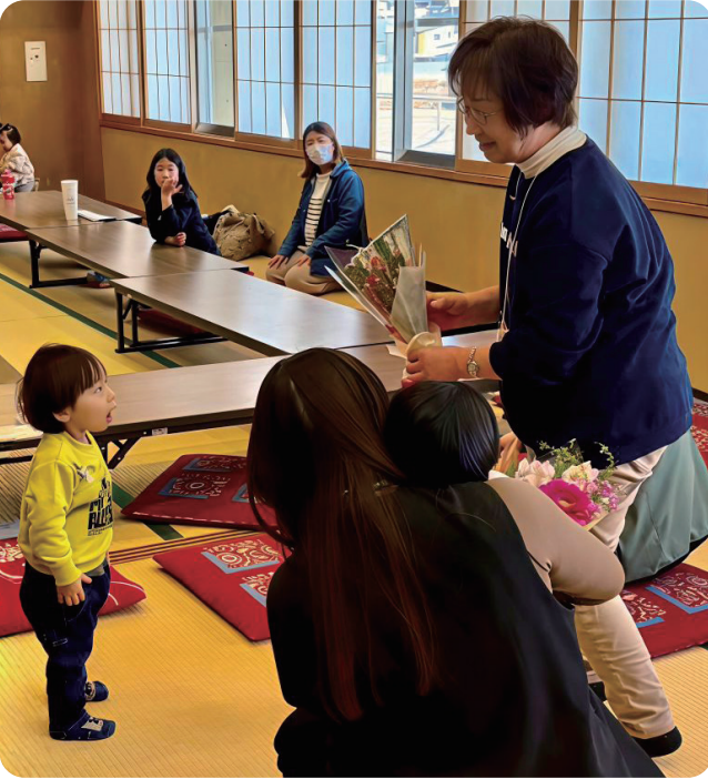
▲素敵な思い出をありがとう!!

〒379-2311 みどり市笠懸町阿左美1581-1 電話：0277-76-2211 FAX：0277-76-2836 Eメール：kouminkan @city.midori.gunma.jp