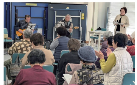
▲会場に響く生演奏♪