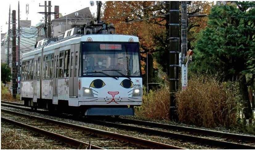
▲トコトコ走る招き猫電車