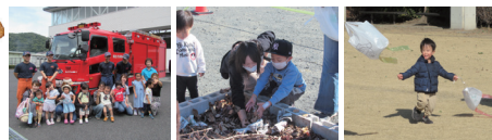
▲R7年度の活動の様子 左から消防署見学、焼き芋、正月遊び その他にも七夕、ハロウィン、節分など盛りだくさん!!