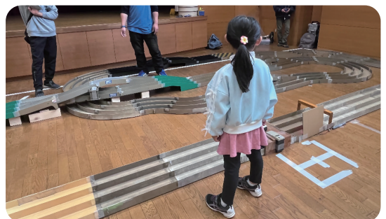
▲ドキドキ!タイムチャレンジ

会場には初めての人も楽しめるようレンタル用のミニ四駆が用意され、一方、ぴったりチャレンジでは記録を達成した参加者にお菓子の景品が贈られました。