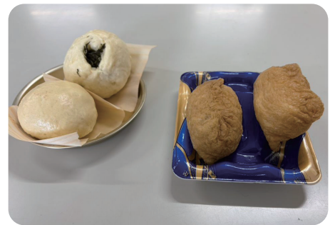
▲ゴジョハンに舌鼓☺

その後は古代米の種まきとサトイモの植え付けに取り組みました。子どもたちが土に触れ、一生懸命作業に励んでいました。作業後には、古代料理研究会から「ゴジョハン(小昼飯)」とし