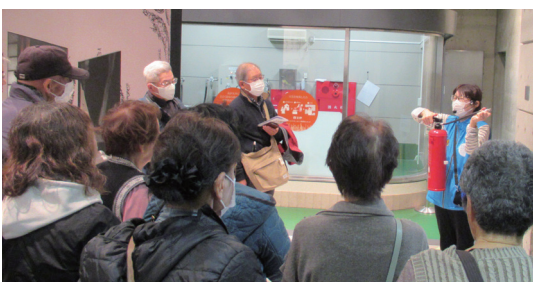
▲昨年度の視察研修より今年も豊かな学びを企画中です!