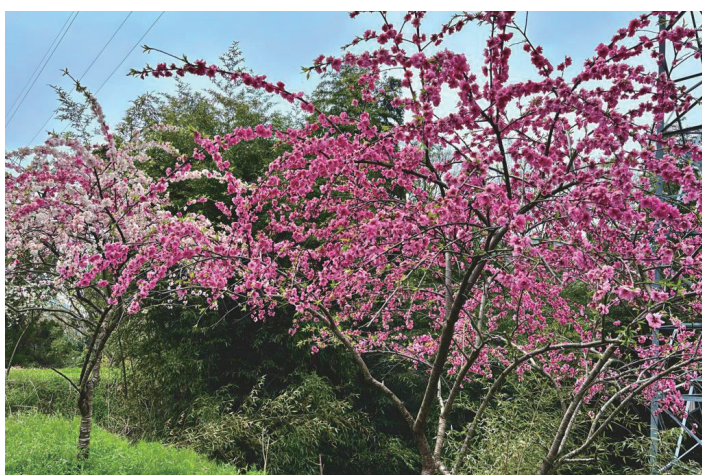
▲山里を鮮やかに彩る

この街道は、花桃の一種「しだれ桃」が2kmに渡り咲き誇ります。30年以上前に一人の住民が一本の花桃