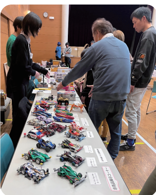
▲懐かしのマシン達

軽快なモーター音と子どもたちの歓声が、笠懸公民館に響き渡りました。4月4日(土)、地域子育て支援センターと・との家主催のイベント「わくわくスペース」が開催されました。交流ホールやロビーなど館内各所を会場に、ミニ四駆のほか、射的やバスボム作りなどのワークショップも行われ、家族連れを中心に多くの来場者で賑わいました。