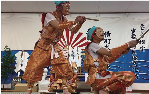
▲地域が誇る重要無形民俗文化財

横町太々神楽春季祭典が4月5日(日)に行われました。阿左美の秋葉神社に伝わる横町太々神楽は、みどり市指定重要無形民俗文化財で100年以上に渡って伝承され、毎年春と秋の2回秋葉神社境内で披露される神事です。