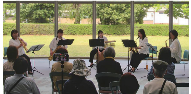
▲新緑を背景に、心なごむ音色が響く

公民館利用者の会主催による「第135回いこいの広場」が、4月19日(日)に笠懸公民館で開催されました。今回は、サククスとカホンによるアンサンブルグループ「サククス四重奏+One」が出演しました。カホンはペルー発祥の木箱型打楽器で、サククスの柔らかな音色とカホンの軽快