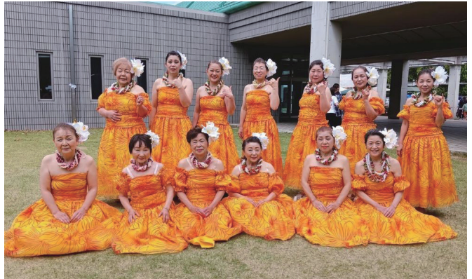
▲日頃の練習を、最高のステージで!

「青空&星空ダンスマルシェ」が4月25日(土)に、ぐんま未来大学ホールPAL(笠懸野文化ホール)野外ステージで開催されました。会場の芝生広場周辺には多くのキッチンカーが並び、賑やかな雰囲気にも包まれました。ステージ前には開始を待ちわびる多くの観客が詰めかけ、イベントの開始と共に会場は一気に熱気に