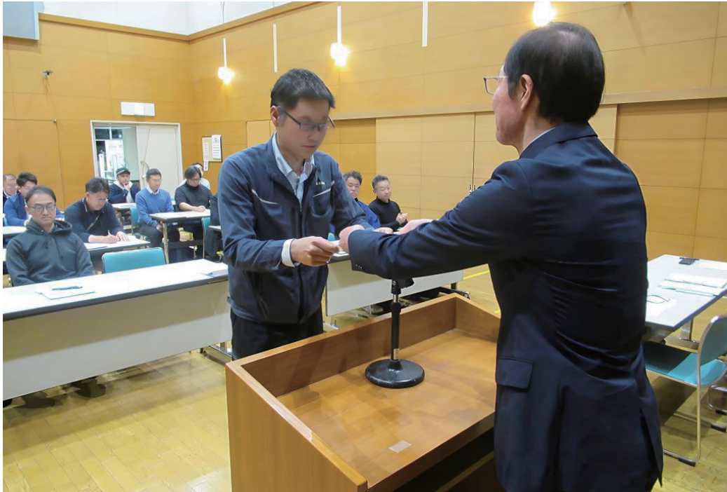
▲地域をむすぶ新たな一歩