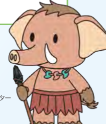
みどり市マスコットキャラクター みどモス