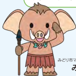
みどり市マスコットキャラクター みどモス

みどり市外にお住まいのみどり市出身の方、みどり市にゆかりのある方、みどり市を応援してくださる方は、ぜひ応援団に入団していただき、みどり市のPR、まちづくりへのご意見など、みどり市の発展にお力添えをお願いします！