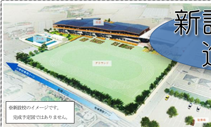
※新設校のイメージです。 完成予定図ではありません。