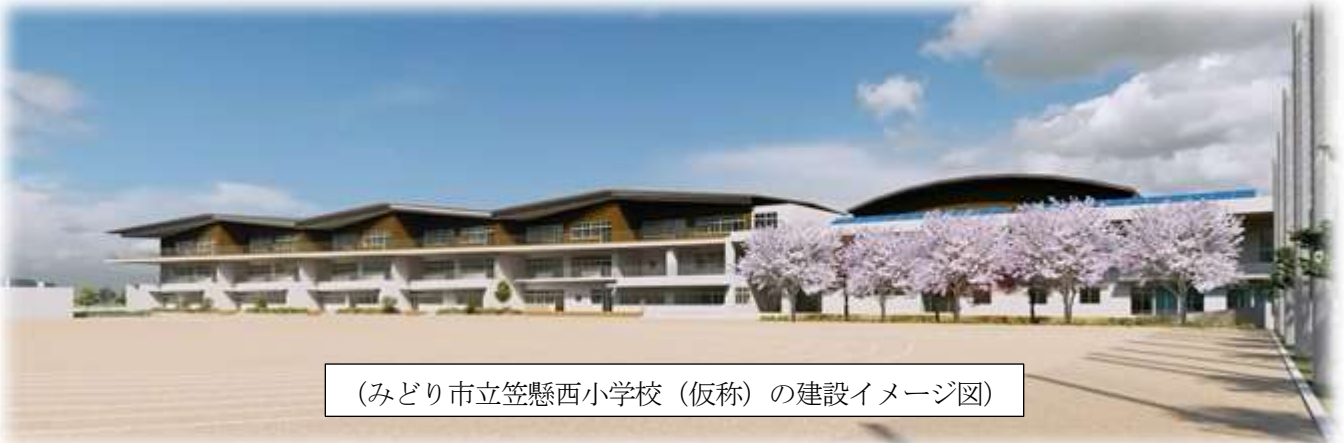
（みどり市立笠懸西小学校（仮称）の建設イメージ図）