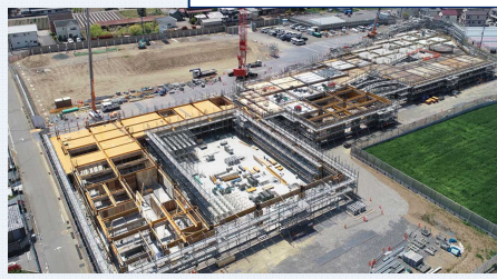
北東側から(手前が体育館です)